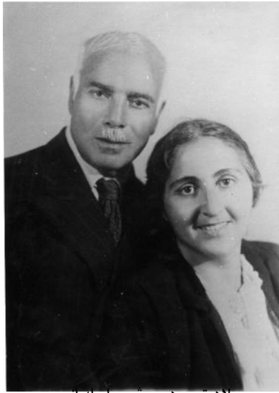
لاهوئی و همسرش سلسله بانو

ابوالقاسم لاهوتی و ماکسیم گورکی در جلسه اتحادیه نویسندگان شوروی ۱۹۳۴